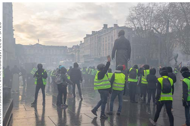
« Les Gilets Jaunes »